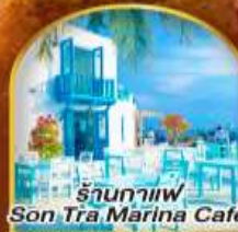
ร้านอาหาร Son Tra Marina Cafe