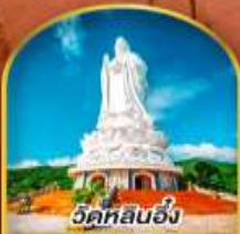
วัดหลันฮั่ง