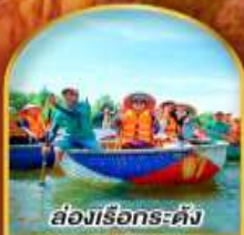
ล่องเรือกระดังง์

17-20, 24-27 เม.ย. / 01-04, 03-06, 08-11 พ.ค. 69