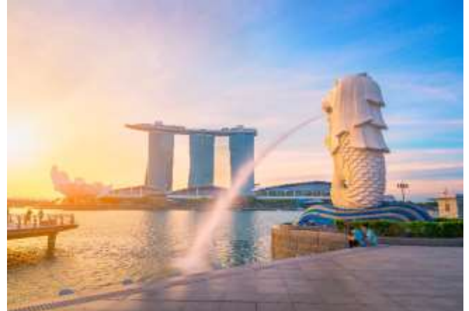
นำท่าน ชมเมือง สิงคโปร์ นำท่าน ถ่ายรูปคู่กับ เมอร์ไลออน

ไลออน สัญลักษณ์ของประเทศสิงคโปร์ โดยรูปปั้นครึ่งสิงโตครึ่งปลาที่หันหน้าออกทางอ่าวมารินา มีทัศนียภาพที่สวยงาม โดยมีฉากด้านหลังเป็น “โรงละครเอสเพลนาท” ซึ่งโดดเด่นด้วยสถาปัตยกรรมคล้ายหนามทุเรียน ชมถนนอลิชาเบรวอลล์ ซึ่งเป็นจุดชมวิวยามเย็นน้ำสิงคโปร์