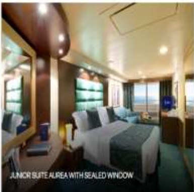
JUNIOR SUITE AUREA WITH SEALED WINDOW