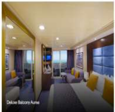
Deluxe Balcony AUREA