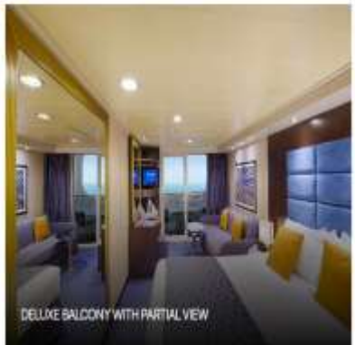
DELUXE BALCONY WITH PARTIAL VIEW