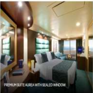
PREMIUM SUITE AUREA WITH SEALED WINDOW