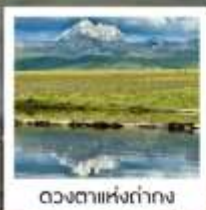
ดวงดาวหิ่งถ้ำกาง