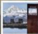
ป่าทางเฉิงตู