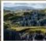
สวนหินปาเหมย์