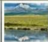
ดวงตาแห่งต้ากิง