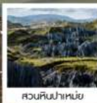
สวนหินป่าเหมย