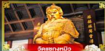
วัดเขangkมัว