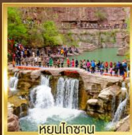
หยุนโกซาน