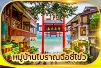
หมู่บ้านโบราณฉือซื่อไป๋