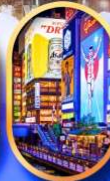
ย่านชิบโฮบาชิ