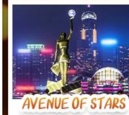
AVENUE OF STARS