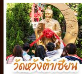
วัดเซ่งต้าซิงหน