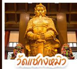
วัดเชกงไฉมว