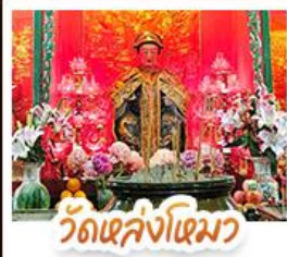
วัดเสล่งไฉมว

นังรทรางพืดแตรมสู่ TOP OF PEAK • ซ้อปบั้งจู้จิมงทัก และ CITYGATE OUTLAETS • นังกระซ่านองบั้ง สีกการะพระใหญ่เทียนทาน • จอพรเจ้าแม่หล่งโหมว แม่งอง 5 มังกร ใ้ประสบความสำเร็จในทุกๆ ค้าน