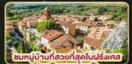
ชมหมู่บ้านที่สวยงามที่สุดในฝรั่งเศส (มูสติเยแซงก์มาร์)