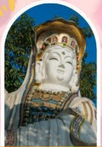
ริพลัสเบย์ รับพลังงานดี เสริมพลังดวงจัญ