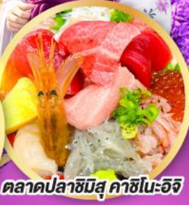
ตลาดปลาชิบุงุ คาชิโนะอิชิ

ถ่ายรูปเช็คอินวิวฟูจิ กับซุ้มประตูโทเซคิจิ แชนมอน อิสระท่องเที่ยว ช้อปปิ้งหนึ่งวันเต็มในโตเกียว