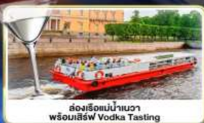
ล่องเรือแม่น้ำวอวา พร้อมเสิร์ฟ Vodka Tasting

📅 เดินทาง : 14-21 มิ.ย.69 / 28 มิ.ย.-05 ก.ค.69 / 24-31 ก.ค.69