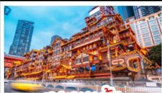
เจียงเฉียวต้ง

อุทยานหุบหม่นบ่อฟ้า - อุทยานเขานางฟ้า หงหยาดัง - นั่งรถไฟทะเลสาบ - อุทยานสี่ดรุณี ปี้ฝิงโกว - สะพานหนานเฉียว