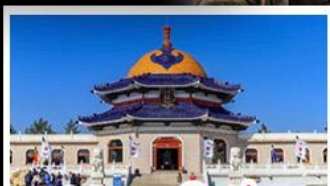
สุสานเจกิสข่าน