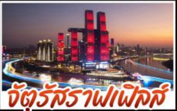
จัตุรัสราฟาเอลิส