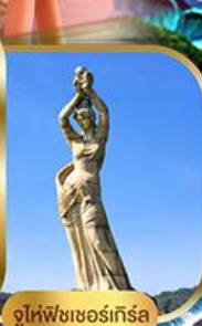
จูไห่ฟิชชอร์ทิวรา