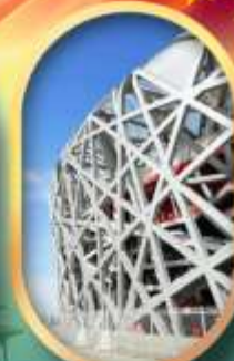
ผ่านชมสนามกีฬาาริงนก