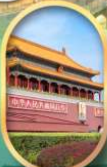
จัสมุติสเทียนอันเหมิน