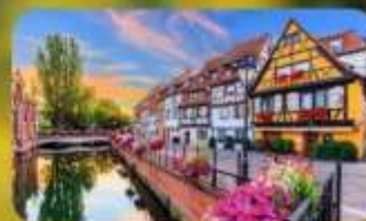
ดินแดนแห่งเทพนิยาย กอลมาร์