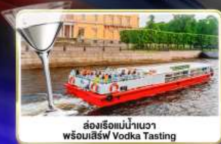
ล่องเรือแม่น้ำแคว พร้อมเสิร์ฟ Vodka Tasting