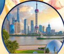
นอร์ทปิ่น กรีนแลนด์