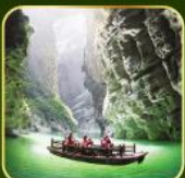
ล่องเรือแม่น้ำไตคินกูฮิว