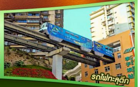
รถไฟฟ้าลัดถ้ำ