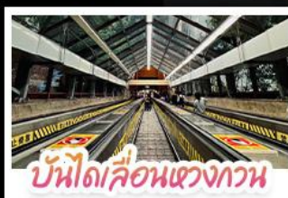
บันไดเลื่อนแขวงกวาน