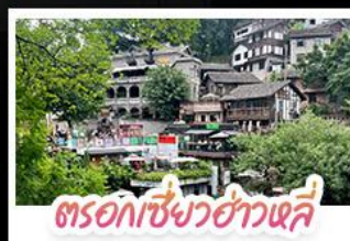
ตรอกเซียวฮ่าวเฉี