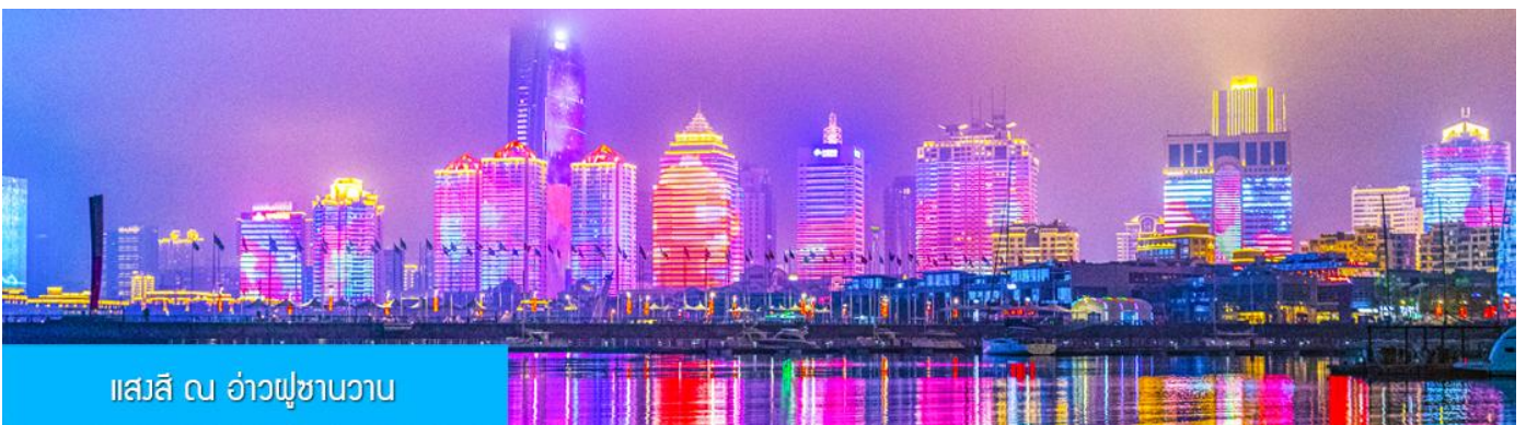
แอสสิ ณ อ่าวฟู่ซานวาว

ค่ำ รับประทานอาหารค่ำ ณ ภัตตาคาร *เมนูซีฟู้ด (3)