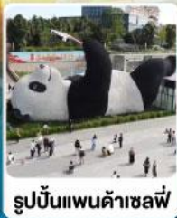
รูปปั้นแพนด้าเซลฟ์