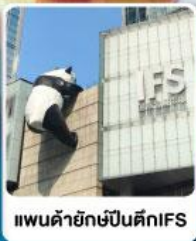
แพนด้ายักษ์ปิ่นตึกIFS