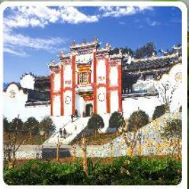
บ้านเกิดชวีหยวน