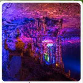
ดำก้ำเทพ