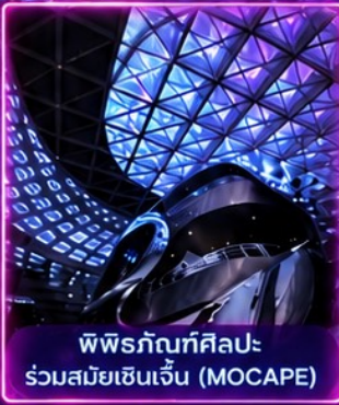
พิพิธภัณฑ์ศิลปะร่วมสมัยเซินเจิ้น (MOCAPE)