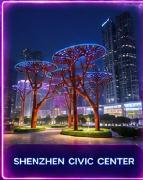
SHENZHEN CIVIC CENTER