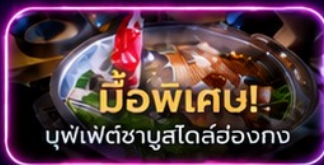
มือพิเศษ! บุฟเฟ่ต์ชาบูสโตสององก

UpperHills จุดถ่ายรูปสุดชิบของวัยรุ่นเซินเจิ้น - OCT Loft ย่าน Creative Park - OCT Harbour Happy Coast - Shenzhen Bay Culture Plaza - Cyberpunk พิพิธภัณฑ์ศิลปะร่วมสมัยเซินเจิ้น (MOCAPE) - Joy City Center (One Avenue) - Shenzhen Civic Center - shigu garden - วัดเจ้าแม่กวนอิม - วัดแชกงหมิว