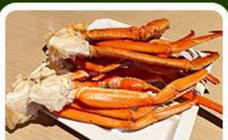
เมนูพิเศษ! ขาปู

เกาะเอโนะชิมะ วิวสวยงามติด 1 ใน 100 ภูมิทัศน์ญี่ปุ่น พร้อมชมพอร์ซาลเจ้าศักดิ์สิทธิ์ เที่ยวเต็มทั้ง 3 วัน แบบจุใจ ทั้งวัด ศาลเจ้า สวนดอกไม้ และช้อปปิ้ง