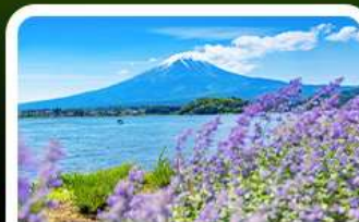
สวนโอะอิชิ ปาร์ค