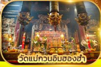
วัดแม่กวนอิมของฮ่า