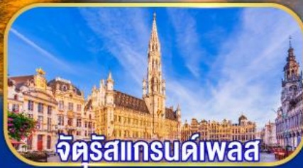
จัตุรัสแกรนด์เพลส