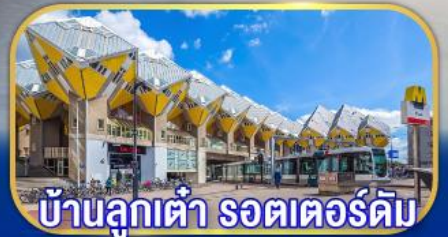
บ้านลูกเต๋า รถเตอร์ดัม

เยือนเมืองเก่าแก่ยุโรป ทั่วมหาสมุทรแอตแลนติก กับการบินไทย บินตรงอัมสเตอร์ดัม