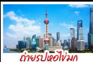
ถ่ายรูปห่อไข่มุก