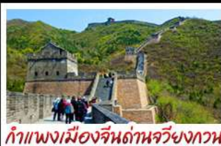
กำแพงเมืองจีนด้านจิวยงกวน

มือพิเศษ เปิดปักกิ่ง, สุกี่หม้อไฟ BUFFET