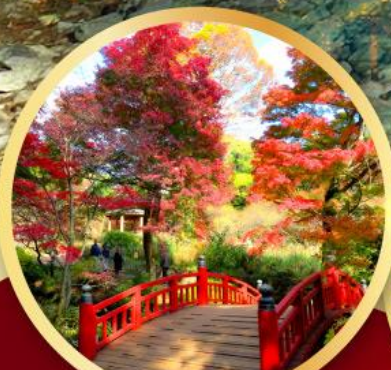
สวนดอกบ๊วยอาคาบิ