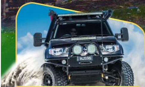
คันรถ 4WD สู้อีกกลางเทือกเขาคอเคซัส