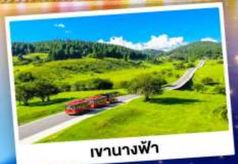
เจานางฟ้า