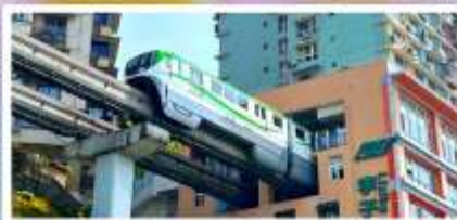
รถไฟฟ้าลู่ตึก