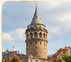
GALATA TOWER หอคอยกาลาตา