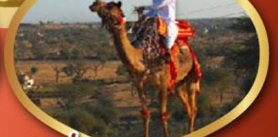
ฟรี ขี่อูฐ เมืองมันทอวา ราคาเริ่มต้น